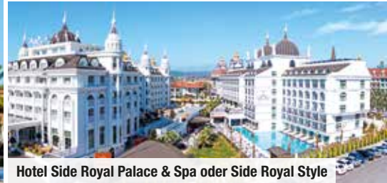
Hotel Side Royal Palace & Spa oder Side Royal Style