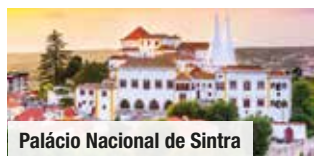
Palácio Nacional de Sintra

Tag 4: Ganztagesausflug an die Algarve mit Sagres, Lagos & Silves