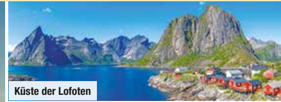
Küste der Lofoten

Inklusive Stadtbesichtigungen von Kopenhagen, Stockholm und Helsinki