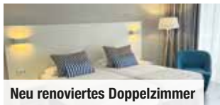
Neu renoviertes Doppelzimmer

Tag 2 bis 7: Im Urlaubsort Puerto de la Cruz sind viele Geschäfte, Bars und Restaurants in den zahlreichen alten Gassen und Straßen zu entdecken. Ein Besuch lohnt sich auch im Botanischen Garten, im wunderschönen Meeresschwimmbad Lago Martiánez und im Loro Parque. Unser Inklusiv-Ausflug führt Sie nach Santa Cruz , Hauptstadt Teneriffas. Die Inselmetropole ist das Zentrum für Shopping, Kunst und Genuss. Noch mehr Insel Schönheiten können mit unseren zahlreichen zubuchbaren Ausflügen entdeckt werden.