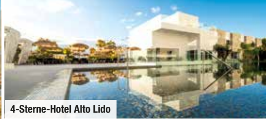
4-Sterne-Hotel Alto Lido