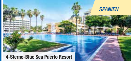
4-Sterne-Blue Sea Puerto Resort