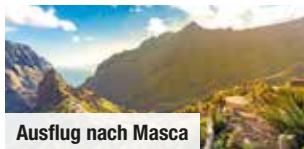
Ausflug nach Masca