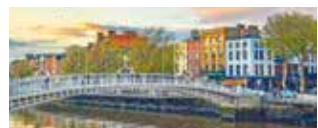
Stadtrundfahrt in Dublin inklusive

Bei Vorabbuchung sparen Sie € 20 p.P. € 139 p.P.