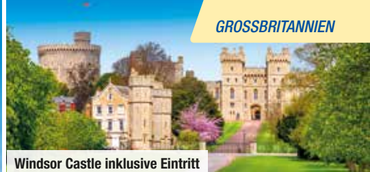
Windsor Castle inklusive Eintritt