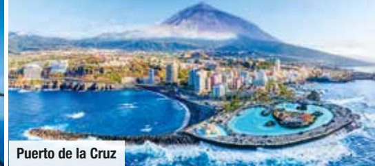
Puerto de la Cruz