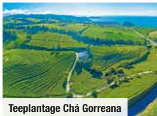
Teepflanzung Chá Gorreana

Tag 8: Rückflug voller wunder-schöner Eindrücke nach Hause.