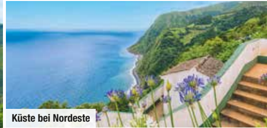
Küste bei Nordeste