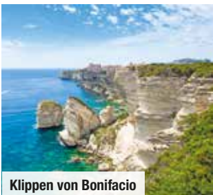
Klippen von Bonifacio

Sichern Sie sich jetzt exklusiv Ihre Außenkabine Nur Vorabbuchung € 59 p.P.